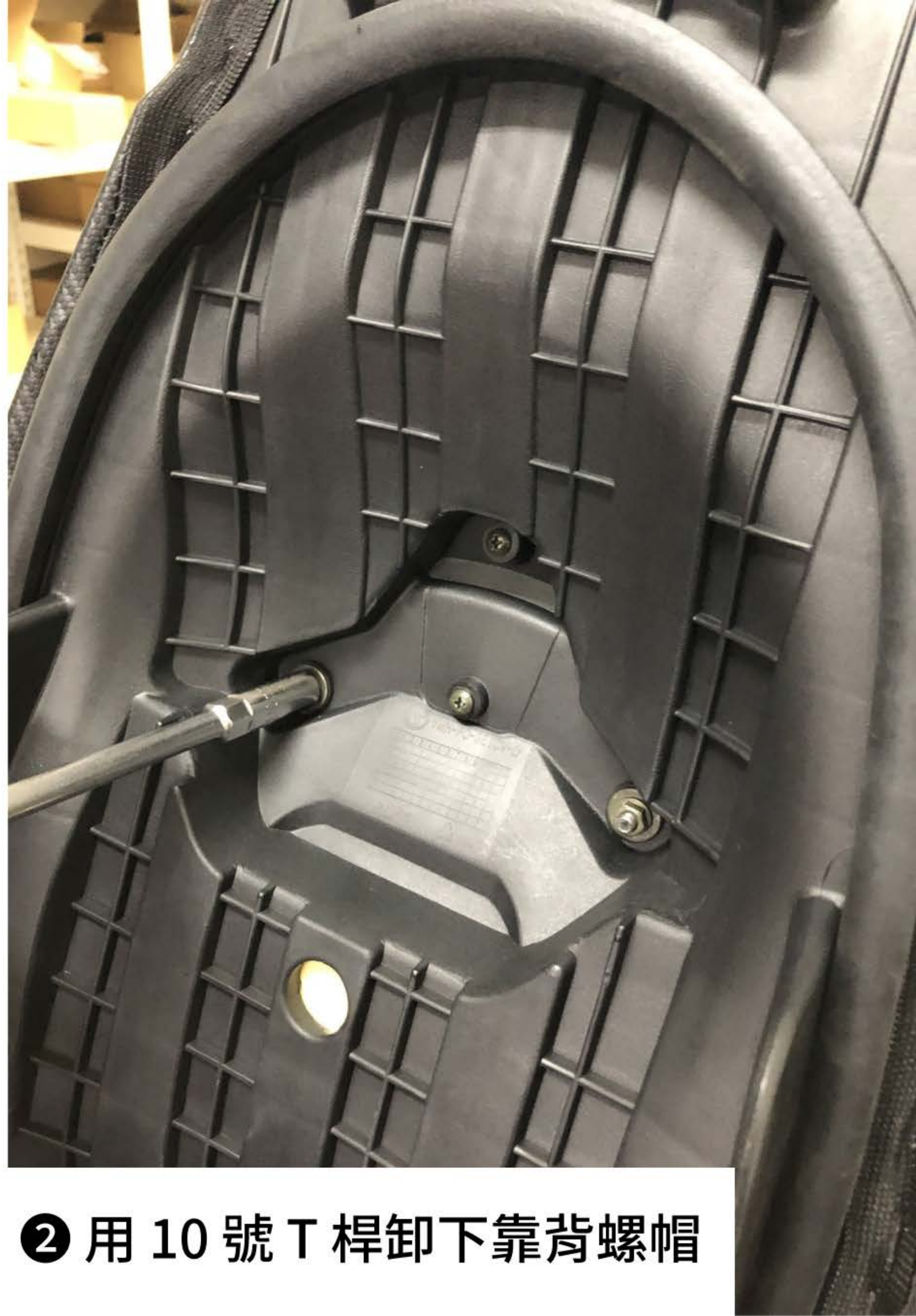
❷ 用 10 號 T 桿卸下靠背螺帽