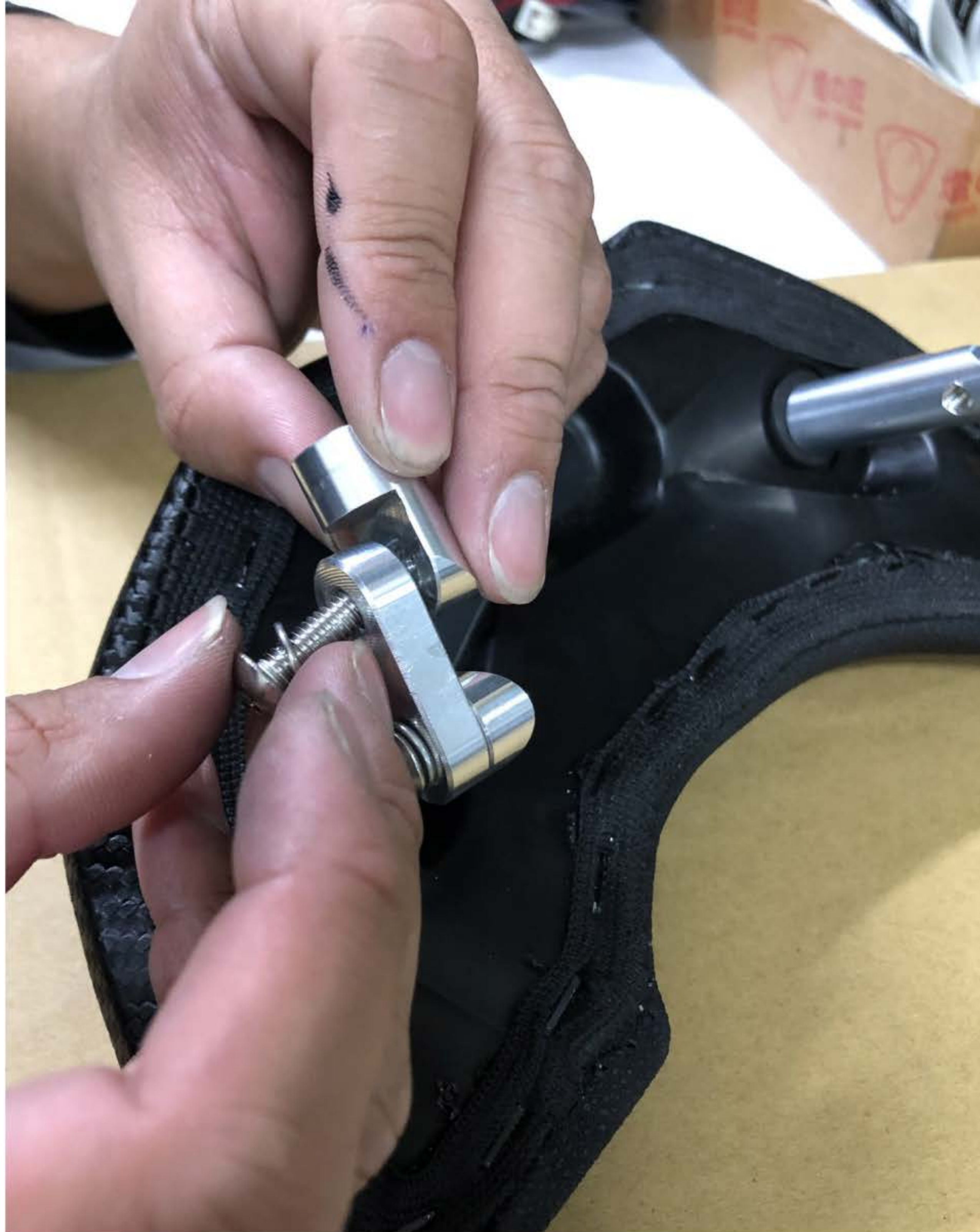
⑩ 再將短套筒鎖至連接座上